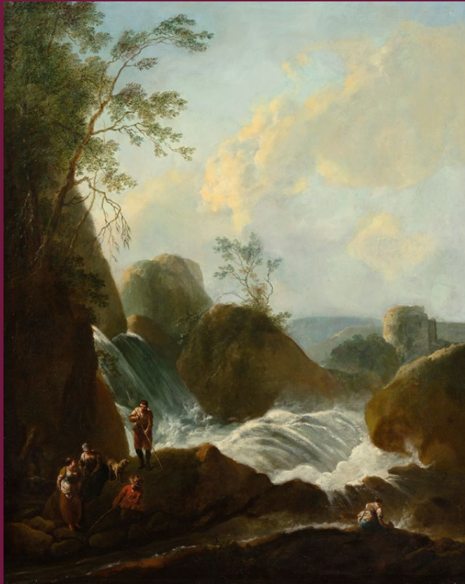
'Rotslandschap met waterval', maker onbekend, ca. 1700, olie op doek, 116 × 98,7 cm. Inventarisnummer: NK1835