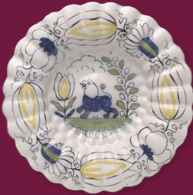
Ploischotel, maker onbekend, 1700-1749, aardewerk, glazuur, 35 cm. Inventarisnummer: NK325-A en -B