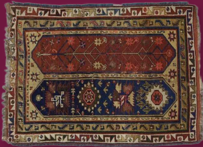
Megri-tapijt, maker onbekend (Turkije), 1800-1824, wol, geknoopt, 185-127 cm. Inventarisnummer: NK1047