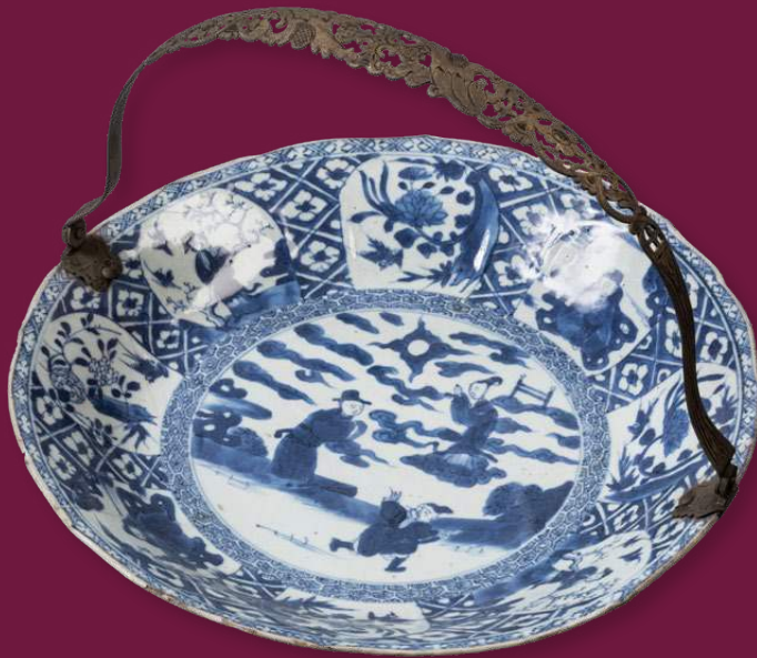
Bord met zilveren hengsel, maker onbekend, 1800-1899, porselein en zilver, 27 cm. Inventarisnummer NK-collectie: NK292