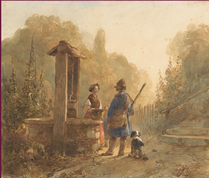
'Jager bij een waterput', Andreas Schelfhout, 1800-1870, aquarel op papier, 19,3 × 22,5 cm. Inventarisnummer NK-collectie: NK3098