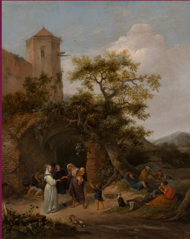
'De Waarzegster', Jan Steen, 1650-1654, olie op doek, 73,5 × 60 cm. Inventarisnummer: NK2727