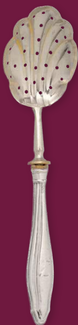
Strooilepel, maker onbekend, verzilverd metaal, 1900-1929, 14,8 cm. Inventarisnummer: NK3591